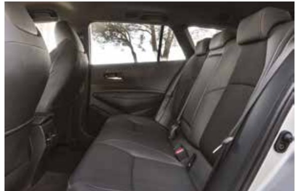
La Toyota Corolla Hybride Auto-Rechargeable 2.0 L