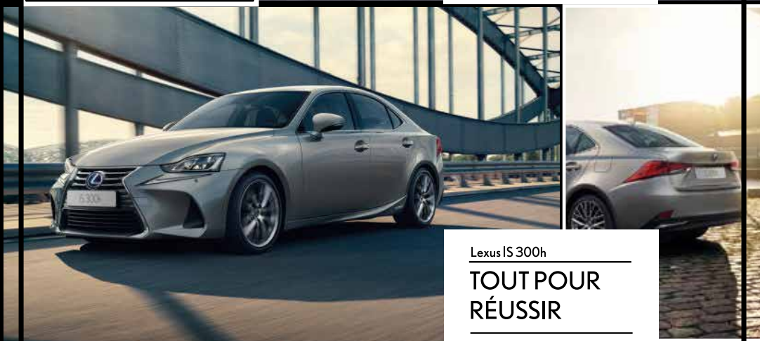
Lexus IS 300h