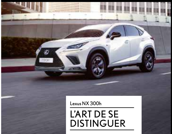
Lexus NX 300h