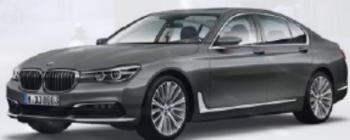
BMW 725d 231ch Berline