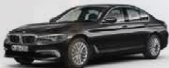
BMW 518d 150ch Berline Finition Luxury