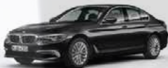
BMW 520d 190ch Berline Finition Luxury