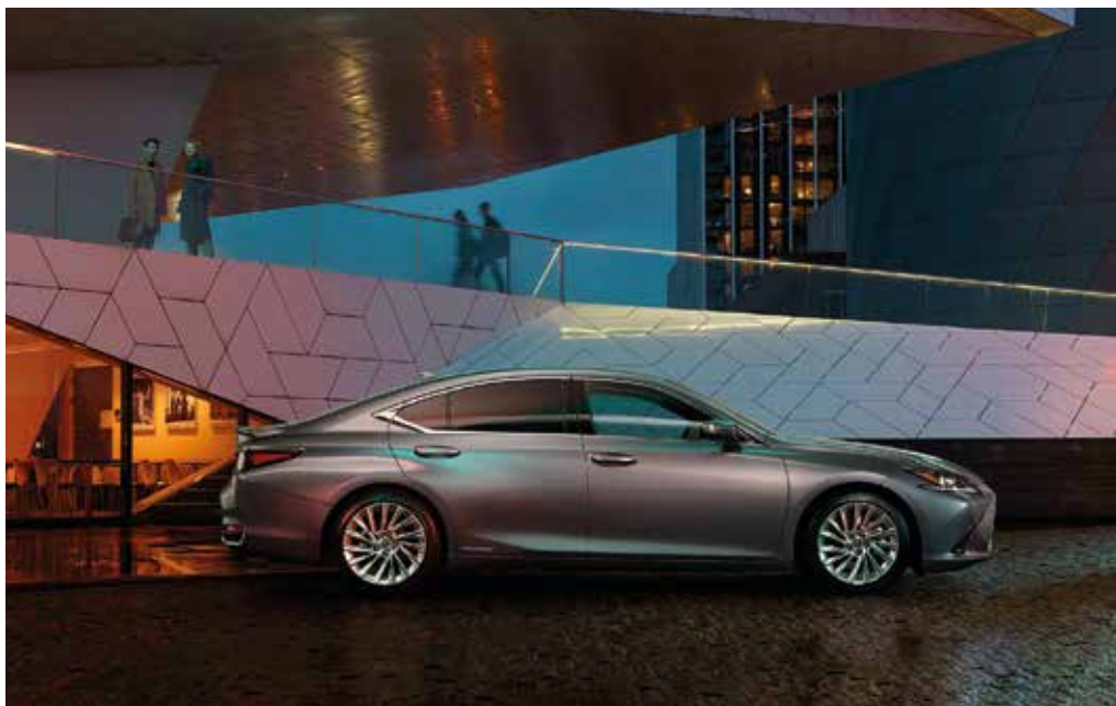
Lexus ES 300h