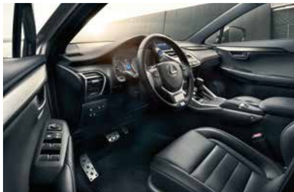
Lexus NX 300h 2 WD Business