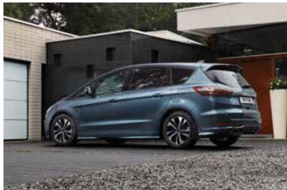
Ford S Max Vignale 2.5 190 ch Hybrid e-CVT