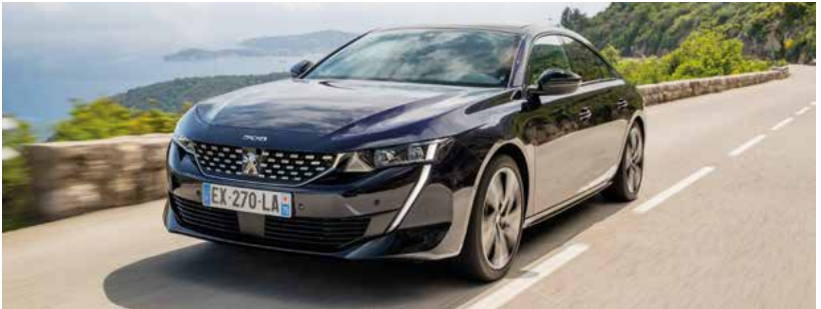
Peugeot 508 Allure Business Blue Hdi 130ch S&S EAT8